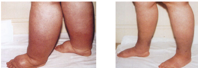
Før og efter forløb med IPC